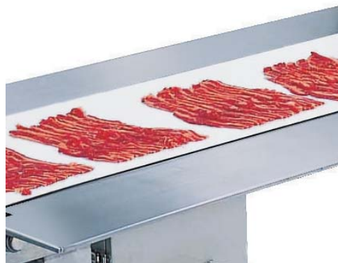
牛バラ 2mm厚 間欠スライス