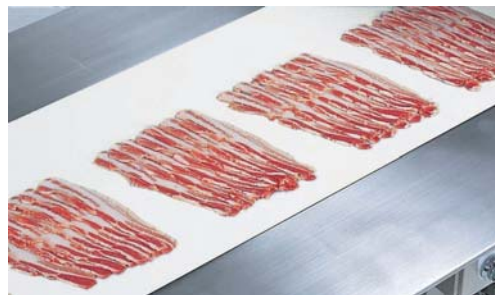
豚バラ 2mm厚 間欠スライス